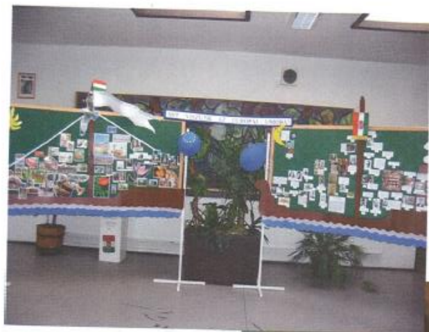
Kiállítás a Tatay-napokon